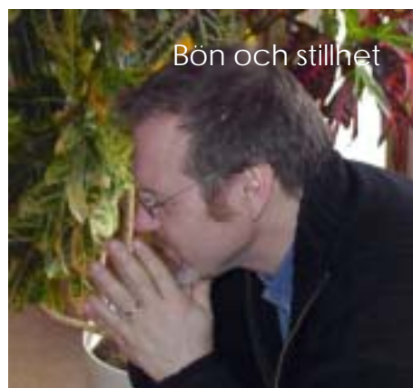
Bön och stillhet